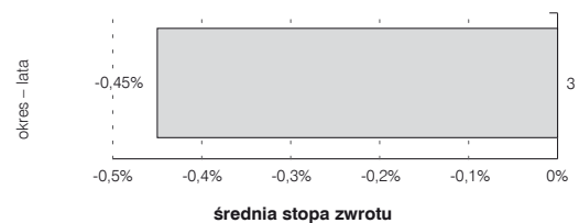
Wielkość średniej stopy zwrotu z przyjętego przez Subfundusz wzorca (benchmarku) za ostatnie 3 lata

Dane dotyczą funduszu Arka BZ WBK Funduszy Akcji Zagranicznych FIO przekształconego w dniu 6 maja 2011 r. w subfundusz funduszu Arka BZ WBK FIO.