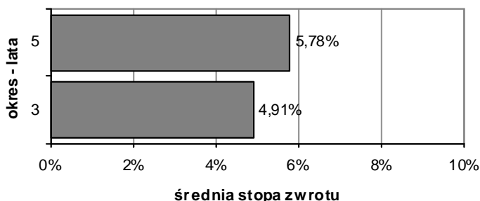
Wielkość średniej stopy zwrotu z przyjętego przez Fundusz wzorca (benchmarku) za ostatnie 3 i 5 lat